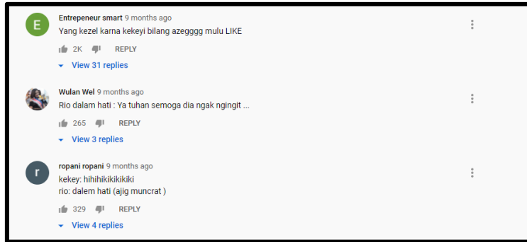
Gambar 2: Agresi Verbal pada akun Kekeyi

Agresi verbal aktif langsung juga ditemukan pada akun Instagram Han So Hee lewat kata-kata seperti ‘pelakor’, ‘perusak rumah tangga orang’ dan ‘perebut suami orang’. Hal ini dikarenakan peran sebagai wanita simpanan yang dilakukannya dalam serial drama Korea, yang membawa serial tersebut sukses mencapai rating tertinggi dalam penayangannya setiap minggu. Penonton yang begitu terpukau dengan serial Drama ini, langsung mneghubung-hubungkan subyek Han So Hee dengan kehidupan nyata, walaupun menjadi ‘orang ketiga’ hanyalah peran saja. Tindakan agresi ini cukup mengganggu dan sedikit mempengaruhi mental subjek, sehingga pada jumpa pers Han So Hee menegaskan agar para pelaku agresi mampu membedakan mana kejadian di dunia nyata dan kejadian di dunia maya. Walaupun demikian, pelaku agresi yang menjadi terbawa emosi, tetap saja menuliskan komentar-komentar bernada sarkasme pada akun Instagram subjek.