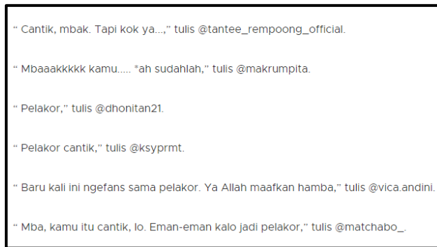
Gambar 4 : rangkuman Agresi Verbal Aktif Langsung pada Instagram Han So Hee.