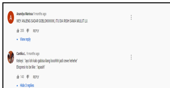
Gambar 1 : Agresi verbal aktif langsung pada akun YouTube Kekeyi

Agresi verbal aktif langsung adalah tindakan agresi verbal yang dilakukan oleh individu atau kelompok, dalam bentuk tindakan langsung seperti menghina dan memaki. Tindakan ini ditemukan pada akun YouTube dari Rahmawati Kekeyi Putri. Komentar-komentar yang secara langsung menghina fisik Kekeyi ditunjukkan lewat kata-kata seperti 'gigi tonggos', 'pendek', 'jelek', 'bau mulut', 'lu bau anjg', dan 'lebay'. Hal ini dilakukan oleh pengguna media sosial lainnya, dengan tujuan untuk menjatuhkan Kekeyi yang dirasa tidak layak untuk terkenal, karena fisiknya yang dianggap jelek dan tidak cantik.