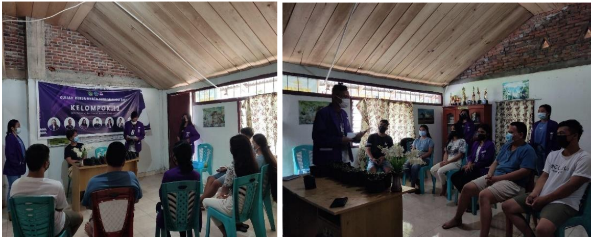
Gambar 5 Edukasi kepada karangtaruna desa Tontalete