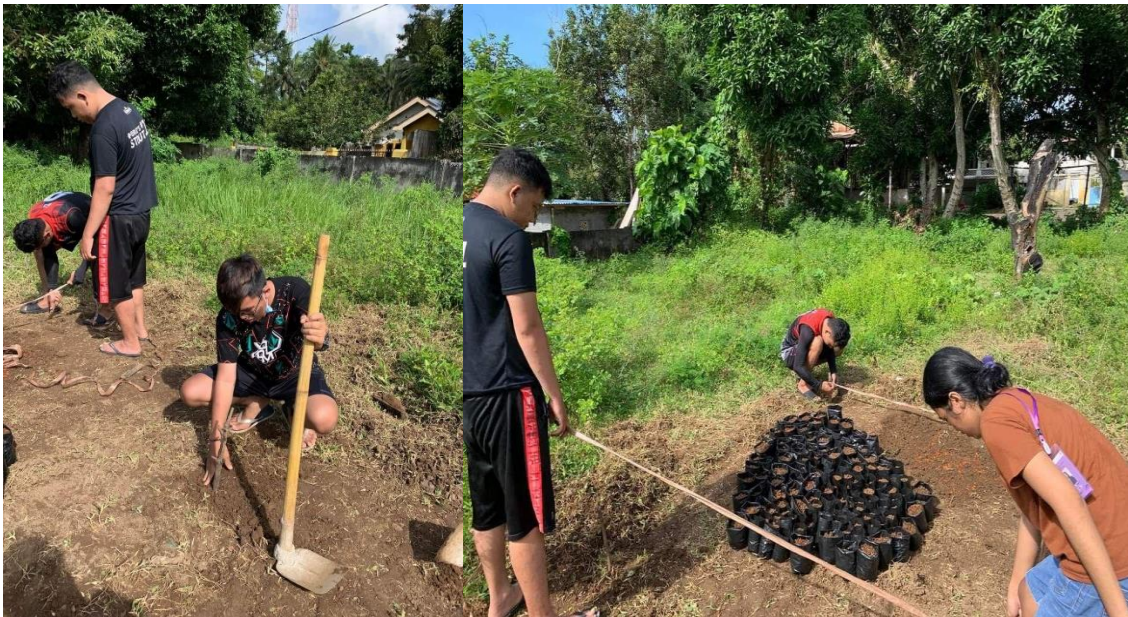
Gambar 4 Pembuatan Patok

Setelah semua sudah selesai maka tim melanjutkan dengan membuat patok untuk dijadikan pembatan dan pembuatan penutup agar penyemaian kami tidak langsung terkena matahari secara langsung.