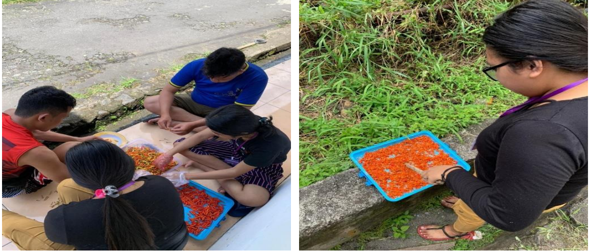
Gambar 2 Proses Pembuatan Bakal Bibit Cabai Rawit