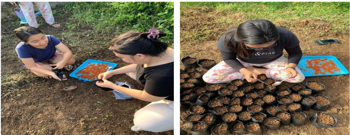
Gambar 3 Proses Penanaman Bibit di Polibag

Pada tanggal 16 Februari 2022 Setelah dilihat bakal calon bibit sudah mengering maka dilanjutkan untuk proses menanam bibit cabai rawit tersebut. Media yang digunakan untuk menanam ialah, polibag. Pemilihan media tanaman polibag ini dilakukan untuk mempermudah dalam memindahkan ke media yang lebih besar jika bibit berhasil tumbuh. Proses ini memakan kurang lebih 3 jam untuk penyemaian bibit cabai rawit tersebut ke dalam kurang lebih 105 polibag. Penanaman ini dilakukan dengan skala 1: 5 dimana satu polibag berisi 5 biji cabai rawit. Dilakukan secara gotong royong 7 orang mahasiswa KKN akhirnya kami berhasil mengerjakan program ini dan menghasilkan 105 polibag yang 1 polibag berisi 5 biji cabai rawit.