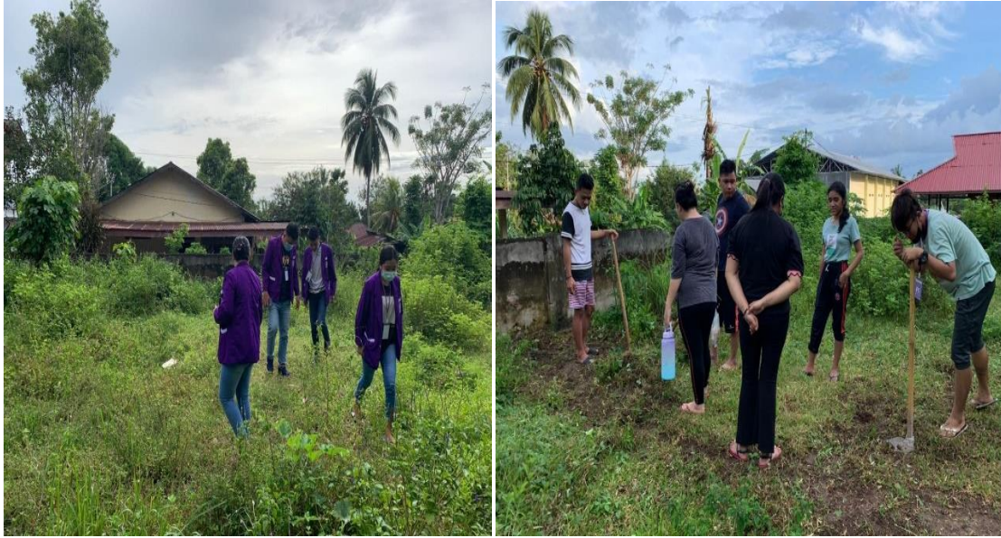
Gambar 1. Pembersihan Lahan