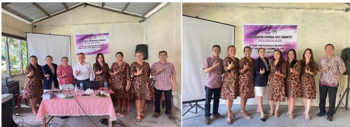
Gambar 4 Foto tim pelaksana PkM