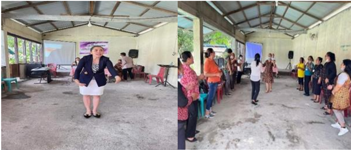
Gambar 2 Kegiatan retreat