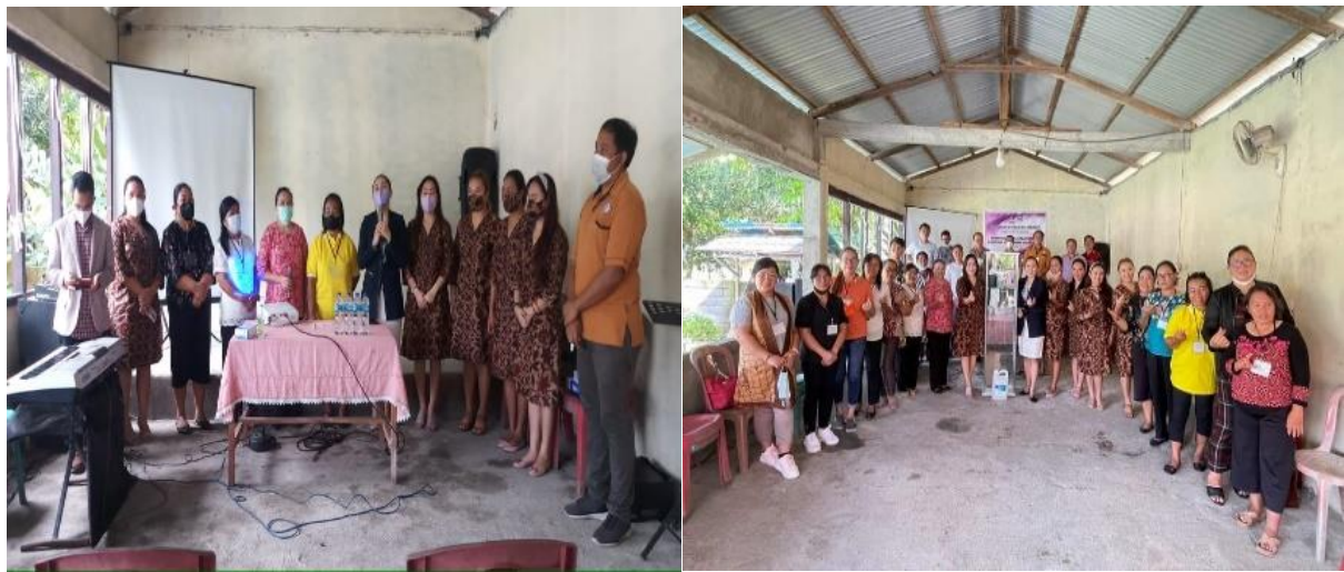
Gambar 3 Foto bersama tim dan calon pelsus