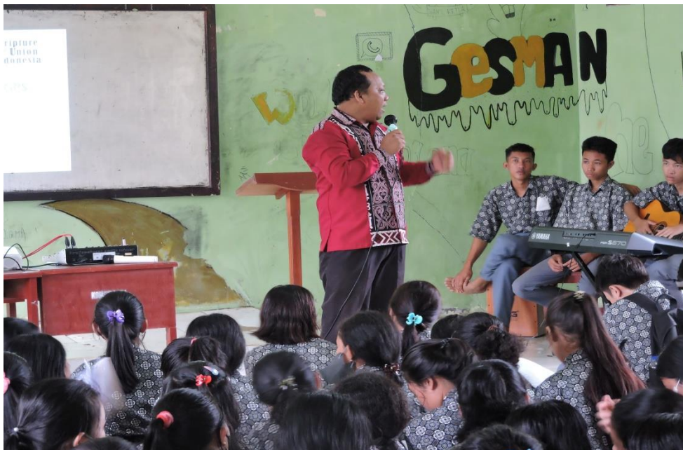
Gambar 2. Setelah sesi Pembukaan

Nats latihan oleh narasumber yang disampaikan berasal dari Injil Matius dan Kejadian. Kitab ini dipilih untuk menyampaikan undangan pertobatan kepada siswa-siswi agar berhenti dari berbagai kejahatan, dosa dan pelanggaran yang selama ini dilakukan. Dengan demikian kegiatan dibuka dengan menggali Alkitab sembari didalamnya ada tantangan untuk bertobat. Pada sesi ini ditutup dengan banyaknya peserta yang mengaku kesalahan-kesalahan yang selama ini telah dilakukan.