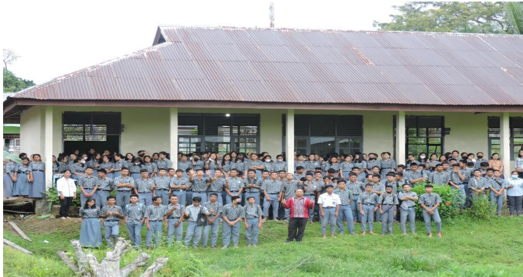
Gambar 1. Setelah sesi Pembukaan

Nats latihan oleh narasumber yang disampaikan berasal dari Injil Matius dan Kejadian. Kitab ini dipilih untuk menyampaikan undangan pertobatan kepada siswa-siswi agar berhenti dari berbagai kejahatan, dosa dan pelanggaran yang selama ini dilakukan. Dengan demikian kegiatan dibuka dengan menggali Alkitab sembari didalamnya ada tantangan untuk bertobat. Pada sesi ini ditutup dengan banyaknya peserta yang mengaku kesalahan-kesalahan yang selama ini telah dilakukan.