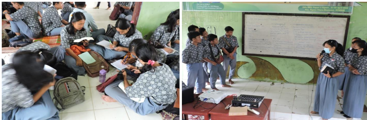
Gambar 3-4 Kerja dan Presentasi Kelompok

Peserta kemudian dibagi kedalam kelompok-kelompok untuk mengerjakan perikop yang telah di bagi pada hari kedua. Antusias peserta tampak dari dimulainya pekerjaan kelompok dalam menggali perikop, mulai dari doa, membaca nats, merenungkan dan kemudian mempresentasikan hasil kerja kelompok.