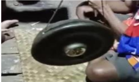
Gambar 3 Gong Sedang

Nggongi To Kodi juga terbuat dari perunggu, berbentuk bundar, memiliki pencon di bagian tengah gong, dan juga dipukul dengan alat pemukulnya yang disebut Tumba . bunyi dari gong ini lebih tinggi dari Nggongi To Bae .