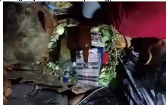
Gambar 8. Posisi Ganda Saat di gantung

Orang tua dan anak muda yang pernah atau bisa memainkan juga telah siap untuk bergantian memukul Nggongi dan Ganda karena tidak ditentukan siapa saja yang boleh memainkan alat musik ini yang terpenting ialah mereka bisa bermain dan menyesuaikan, sebab apabila terjadi kesalahan pada saat proses pengobatan maka Tau walia bisa jatuh pingsan. Kemudian tuan rumah tempat pelaksanaan Mobolong mempersilahkan kepada tau walia untuk mengambil tempat tapi terkadang tau walia langsung melakukan tugasnya, namun ia juga dapat menunggu sampai beberapa waktu barulah pengobatan dilaksanakan sambil mongo (mengunyah sirih dan pinang).