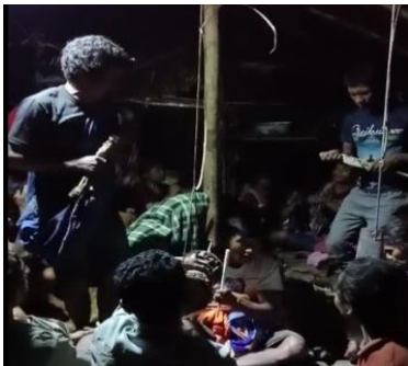
Gambar 9. Tau Motaro

Sebelum Tau walia memulai tugasnya maka terlebih dahulu seorang perempuan atau laki-laki berdiri memegang wunga (kemangi) dan menutup mata sambil mataro atau yang dalam bahasa Taa berarti melompat/menari. Hal ini dilakukan untuk memanggil roh-roh leluhur. Usai dilakukannya mataro dalam beberapa menit tau walia akan mengambil kain paploncu yang akan digunakan untuk memeriksa atau menangani jiwa pasien. Ia juga kemudian mengambil beberapa wunga yang digosok-gosok ditubuhnya. Aroma wunga inilah yang menarik datangnya roh-roh yang dipanggil sambil melantunkan doa . Setelah beberapa lama, kemudian tau walia berdiri dengan kain paploncu dan wunga yang dipegangnya lalu secara tidak sadar ia mulai mataro . Motaro ini adalah gerakan naik