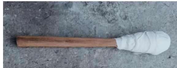
Gambar 2. Tumba

Seperti gong pada umumnya gong yang digunakan oleh Suku Taa terbuat dari perunggu, berbentuk bundar, memiliki pencon dan dipukul menggunakan alat pemukulnya yang disebut Tumba yang dalam bahasa Taa artinya pukul. alat pemukul dari gong ini terbuat dari kayu yang ujung dari pemukulnya dibungkus dengan kain. Orang yang bertindak sebagai pemain alat musik ini disebut To Myingko Nggongi