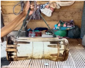
Gambar 7. Bahan yang digunakan saat ritual

yaitu tumba dan pedek , Nggongi dan pemukulnya yaitu tumba . Sementara itu bahan yang dibutuhkan untuk pelaksanaan ritual ini berupa Wunga , Pangopi , Tule , Tabako , Wea Mapuyu , Kapongo yang berisikan Tiula , Wua , Tampono . Lalu bahan ini diberikan kepada Tau Walia dan digunakan untuk memberikan kekuatan. Kemudian bahan ini diletakkan dalam sebuah baki atau biasa di sebut Langu (alat untuk menapis beras) dan dilengkapi juga dengan kulit jagung untuk pembungkus rokok tembakau ( Tabako ), kain atau baju sebagai Kabuya Ndaya (tanda terima kasih) kepada Tau Walia , dan paploncu (kain yang berukuran kecil) yang digunakan oleh Tau Walia untuk mengeluarkan penyakit pada pasien.