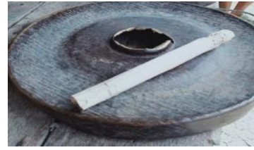
Gambar 1. Gong Besar

Dikatakan Nggongi To Bae karena gong ini memiliki ukuran yang lebih besar dari gong lainnya dan ukurannya berdiameter sekitar 41 cm. Seperti pada alat musik lainnya, jika semakin lebar ukuran diameternya maka bunyi yang dihasilkan semakin rendah.