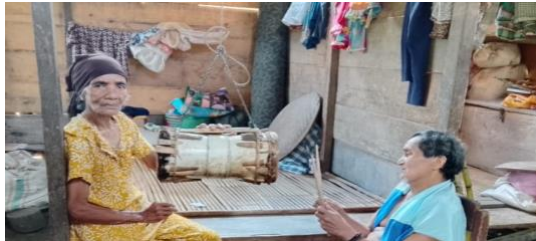
Gambar 5. Topo Ganda

Orang yang memainkan instrumen ini disebut dengan Topo Ganda , mereka berperan sebagai pengatur ritme dari alat musik yang dimainkan. Posisi dari Topo Ganda ialah saling berhadapan dengan masing-masing ujung membran Ganda .