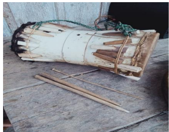
Gambar 4. Ganda, Pedek, dan Tumba

Alat musik ini dipukul dengan batang kayu yang disebut dengan Pedek dan sepasang Tumba . Pedek terbuat dari rotan yang ujung bawah rotan tersebut diikat simpul yang fungsinya sebagai pegangan agar tidak mudah terlepas dari tangan pemain. Sedangkan Tumba terbuat dari kayu ringan apa saja tapi biasanya juga menggunakan kayu Pli'o , nilo , atau lui . Cincin yang berada di tengah ganda adalah dekorasi yang terdapat lubang berdiameter kurang dari 1 cm yang juga berfungsi sebagai ruang resonansi.