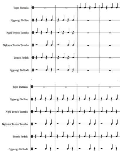
Gambar 6. Partitur Pakoba Manoto

Pola ritme yang berulang-ulang dan dimainkan sepanjang malam ini membantu memfokuskan pikiran dan menciptakan suasana yang kondusif untuk penyembuhan agar masuk ke dalam keadaan yang memungkinkan interaksi dengan roh penyembuh.