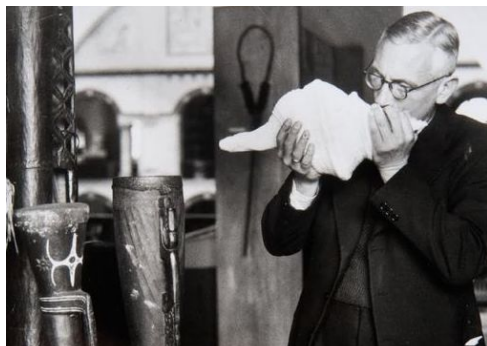
Gambar 2. Jaap Kunst sedang memainkan Triton, terlihat didepannya ada alat musik Nusantara yang lainnya.

Di pertengahan abad ke-20, ditemukannya teknologi merekam suara memudahkan para etnomusikolog untuk mengumpulkan berbagai macam data di lapangan secara langsung, tentu hal ini lebih efisien dan akurat. Teknologi rekaman tersebut membuka pintu lebih jauh pengetahuan tentang fenomena musik-musik tradisional dan regional yang awal lebih sulit diabadikan. Adapun salah satu etnomusikolog terkenal di Indonesia yang menggunakan instrument perekam suara pada awal abad ke-20 adalah seorang Belanda yang bernama Jaap Kunst, dia berkeliling Indonesia berusaha untuk mengumpulkan dan mempelajari banyak instrument musik 18 .