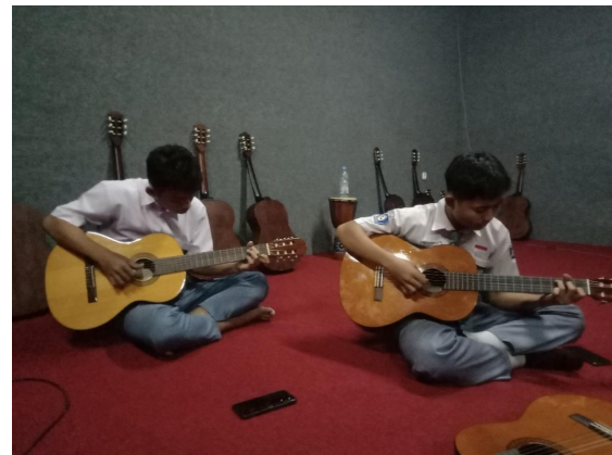
Foto 10 Siswa Memainkan Materi Vals Karya Bartolome Calatayud.

mempromosikan saling menghormati dan pengertian antara siswa yang bekerja sama. Metode tutor sebaya (peer teaching) ini memfasilitasi pembelajaran dengan siswa berpartisipasi aktif dan dapat memecahkan masalah secara bersama-sama sehingga pemahaman terhadap materi pembelajaran yang diberikan merata.