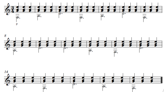
Foto 3 Materi Penjarian Tangan Kanan.

siswa bernama Keysia mengalami kesulitan pada penentuan jari yang sesuai partitur ketika tempo mencapai 120 bpm. Mengatasi hal tersebut, guru memberikan materi di atas kepada Keysia dengan tetap pada tempo tercepat yang dapat siswa tersebut mainkan yakni pada tempo 100 bpm dan dilakukan secara berulang hingga siswa tersebut dapat memainkan dengan penjarian yang sesuai pada setiap notasi dengan presisi tempo yang baik. Setelahnya pembelajaran dilanjutkan dengan memberikan materi penjarian tangan kanan tahap ke dua dengan materi sebagai berikut: