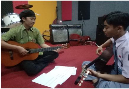
Foto 6 Demonstrasi Materi Di Atas Pada Siswa yang Mengalami Kendala.

Setelahnya materi dilanjutkan guru memberikan materi tangga nada G Mayor dua oktaf. Materi tangga nada G Mayor di bawah ini terdapat angka kecil di atas notasi yang mengharuskan siswa untuk memainkan dengan posisi jari tangan kiri sesuai pada