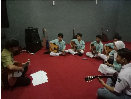
Foto 9 Demonstrasi Materi Vals Karya Bartolome Calatayud.

Pada pelaksanaannya, lima siswa dapat memainkan repertoar hingga selesai pada tempo