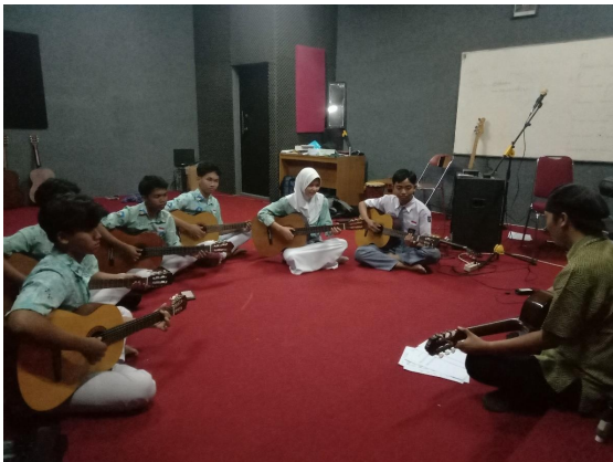
Foto2 Demonstrasi Materi Di Atas Pada Penjarian Tangan Kanan Dengan Teknik Memetik Tirando .

atas, dilakukan secara berulang selama kurang lebih lima menit dengan menggunakan metronom pada tempo 80 bpm. Guru terlebih dahulu memberikan contoh dengan memainkan partitur di atas secara lengkap menggunakan tempo 80 bpm dengan menerapkan teknik memetik tirando dan penjarian yang digunakan sesuai dengan partitur di atas.