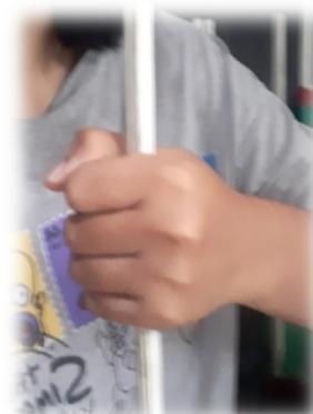
Gambar 3. Cara Memegang Keroncong Besar dan Keroncong Kecil Dalam Posisi Duduk

Cara memegang Keroncong Besar, Keroncong Kecil, Kontra dan Bass dalam posisi berdiri yaitu dengan cara semua jari-jari menghadap kebawah. Untuk lebih jelasnya dapat dilihat pada gambar berikut.