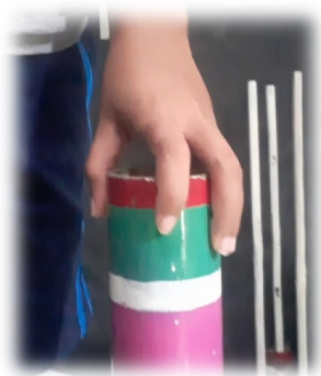
Gambar 5. Cara Memegang Kontra dan Bass Dalam Posisi Berdiri